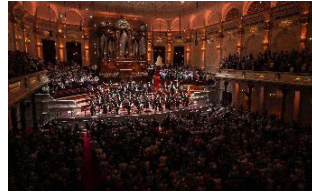
演出於阿姆斯特丹音樂廳獲觀眾起立鼓掌